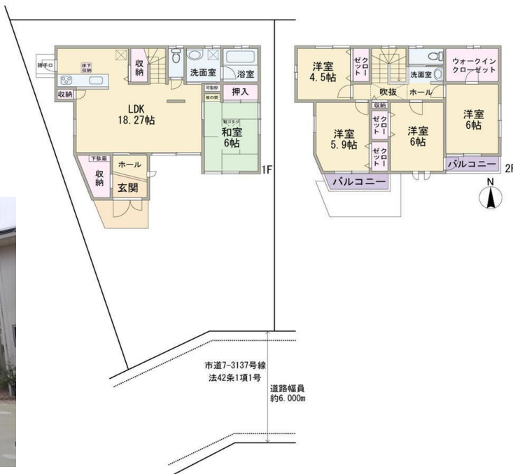
間取り図 3380万円、5LDK、土地面積188.97㎡、建物面積119.7